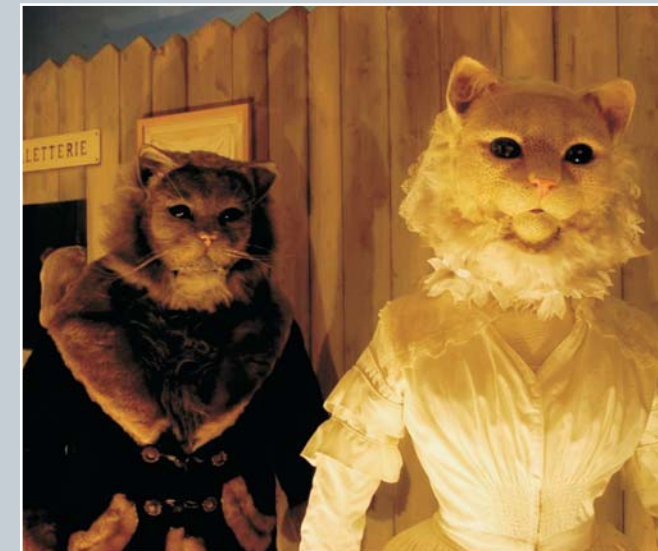
Penas del corazón de una gata inglesa.