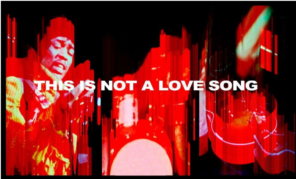
Largen & Bread: This is Not a Love Song (Hendrix) 2013/2020

This is not a love song es la tercera parte de una trilogía de exposiciones que se han realizado en el Fernán Gómez. Centro Cultural de la Villa con las cuales intentamos trazar una genealogía de las relaciones entre las artes visuales y la música pop desde la segunda mitad del siglo XX hasta la actualidad, poniendo énfasis en aquellos momentos en los que ambas manifestaciones se retroalimentaron y se movieron sincrónicamente en el territorio de la experimentación, la utopía o la incorrección política.